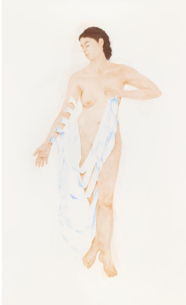
créer des ailes | 2024, dessin crayon de couleur sur papier, 210x130 cm, Photographie Robson Lemos ©Clara Moreira

Établissant une atmosphère d'étrangeté et de proximité avec son propre corps, le travail de Clara Moreira est une sorte d'archive de gestes performatifs et quotidiens consignés par le dessin. En utilisant le corps comme grammaire, Clara trace une voie dans laquelle subjectivité du moi et glissements de la représentation physique, génèrent des œuvres qui remettent en question le binôme réalité/fiction. Car si nombre de ses travaux ont une dimension onirique, c'est par l'expérience esthétique de l'intime, et la corporalité de leur présence, qu'elles prennent tout leur sens. Le dessin est certes le fruit d'une imagination libre, mais aussi partie intégrante du corps de l'artiste - puisque c'est par le geste comme réponse, entre la main, le crayon de couleur, et le papier qu'il se manifeste. Ainsi, matière physique et rêve se confondent, générant détours et miroitements déformés.