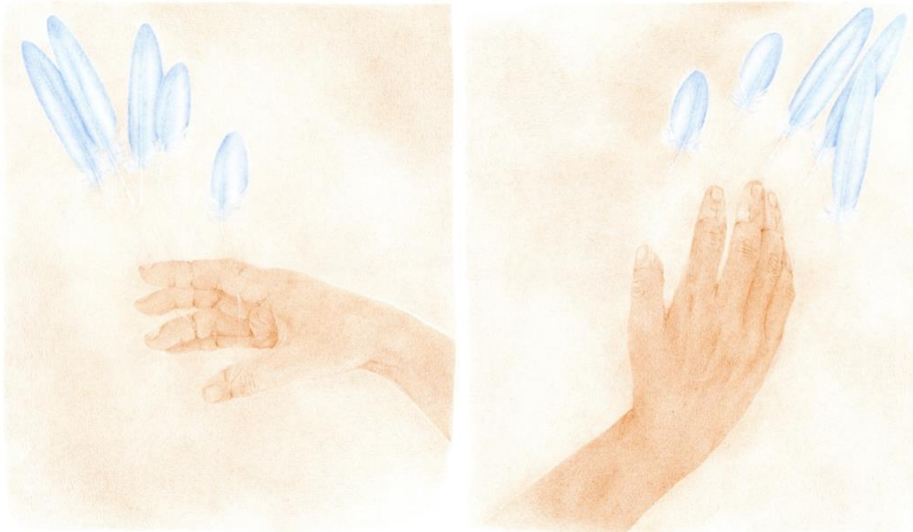
Dedos-rêmités I, 2024, dessin crayon de couleur sur papier de coton, 35x30cm (gauche) ©Clara Moreira Dedos-rêmités III, 2024, dessin crayon de couleur sur papier de coton, 35x30cm (droite) ©Clara Moreira

La physionomie qui nous fixe dans les œuvres de Clara Moreira n'offre pas toutes les clés pour la reconnaître lorsque nous la rencontrons. On identifie similitudes et dissemblances entre l'artiste et son double. Tous deux ne craignent pas de se dévoiler, mais il y a une gravité dans la Clara dessinée qui laisse entrevoir l'intériorité de l'autre, et montre la concentration nécessaire pour tracer l'image reflétée dans le miroir.