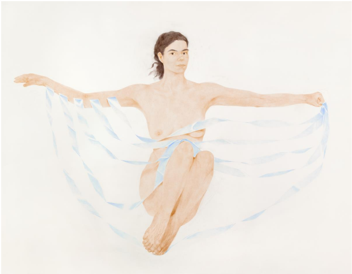
créer des ailes II 2024, dessin crayon de couleur sur papier, 130x185 cm, Photographie Robson Lemos ©Clara Moreira