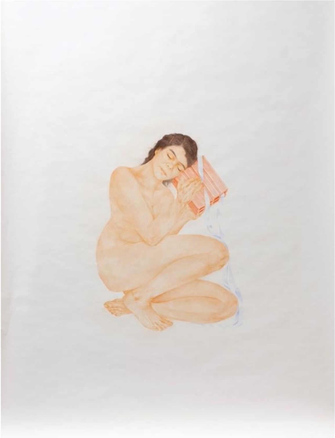
Promessa da casa III, 2022, dessin crayon de couleur sur papier, 180x140 cm, photographie Ricardo Mitadas ©Clara Moreira