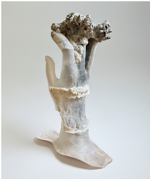
Main, 2024 © Keanu Lebon Courtesy Salon H

explorent la transformation de la matière et les tensions entre l'intérieur et l'extérieur, l'humain et le non-humain. Cependant, là où Cenci et Andriessen se concentrent sur les mutations organiques de la matière, les œuvres de Lebon introduisent une dimension mystique et spirituelle.