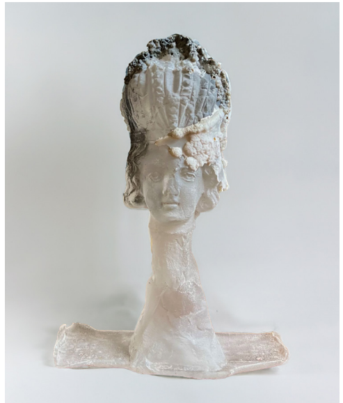
Enfant, 2024 © Keanu Lebon Courtesy Salon H

Dans certaines pièces récentes de la série Tangere, comme Tangere 2 ou Tangere 5 (verre et bronze), des formes humaines émergent verticalement: bustes élancés, fragments de jambes, silhouettes partiellement translucides dont la surface semble marquée par la chaleur, la fusion ou la stratification de matériaux hétérogènes. Ces œuvres prolongent la réflexion initiale du projet : révéler un corps devenu membrane, surface trouée, peau minérale.