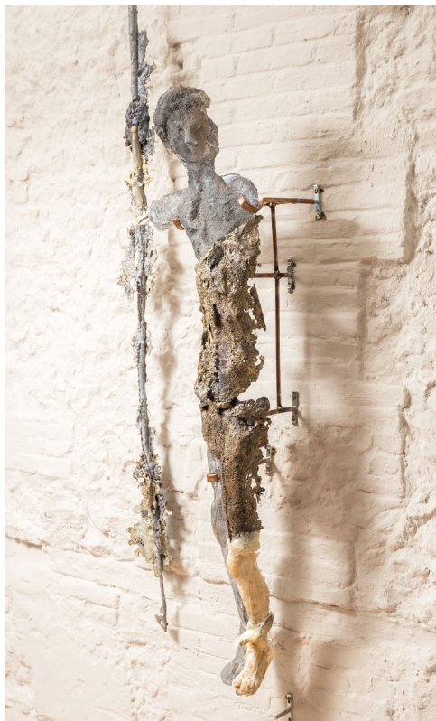
Tangere #06, 2025 © Keanu Lebon Courtesy Salon H

Leur dimension dépendait du souffle du maître verrier, c'est-à-dire de la capacité de ses poumons — cet organe que l'anatomie commence alors à découvrir.