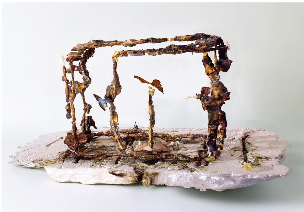
Relicarios #02, 2025