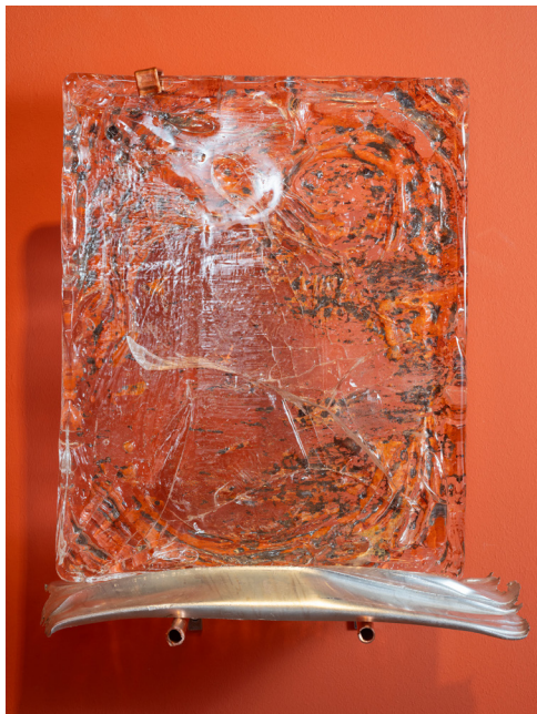
Tangere #11, 2025

Dans un contexte où humain et dispositifs technologiques fusionnent et mutent rapidement, l'artiste explore un corps certes devenu hybride, mais réinvesti de son mystère.