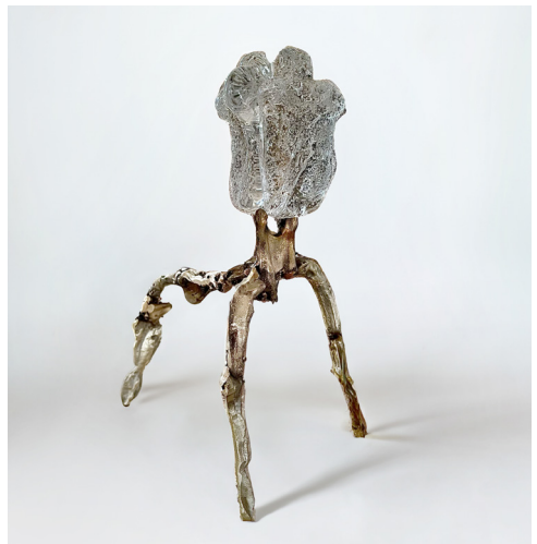
Tangere #07, 2025

Ces travaux résonnent avec les recherches de jeunes artistes comme Giulia Cenci et Isabelle Andriessen, dont les installations biomorphiques et les sculptures organiques