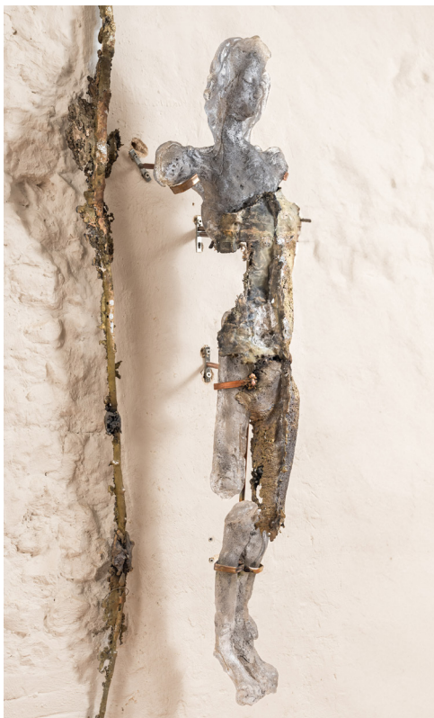
Tangere #02, 2025

À l'origine de ce projet, deux événements majeurs survenus en Italie au XVI e siècle : la publication des planches anatomiques du De Humanis Corporis Fabrica de Vésale et l'invention des miroirs au mercure sur l'île de Murano. À cette époque, les miroirs naissaient de bulles de verre soufflé, coupées en deux, puis recouvertes d'un alliage de mercure et d'étain.