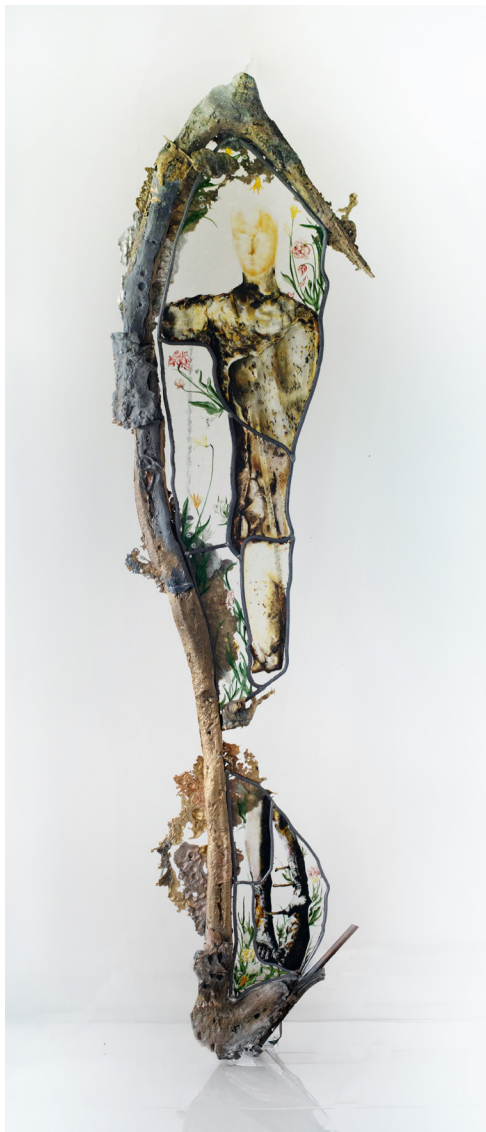
OrganoPoïèse, 2025 © Keanu Lebon Courtesy Salon H