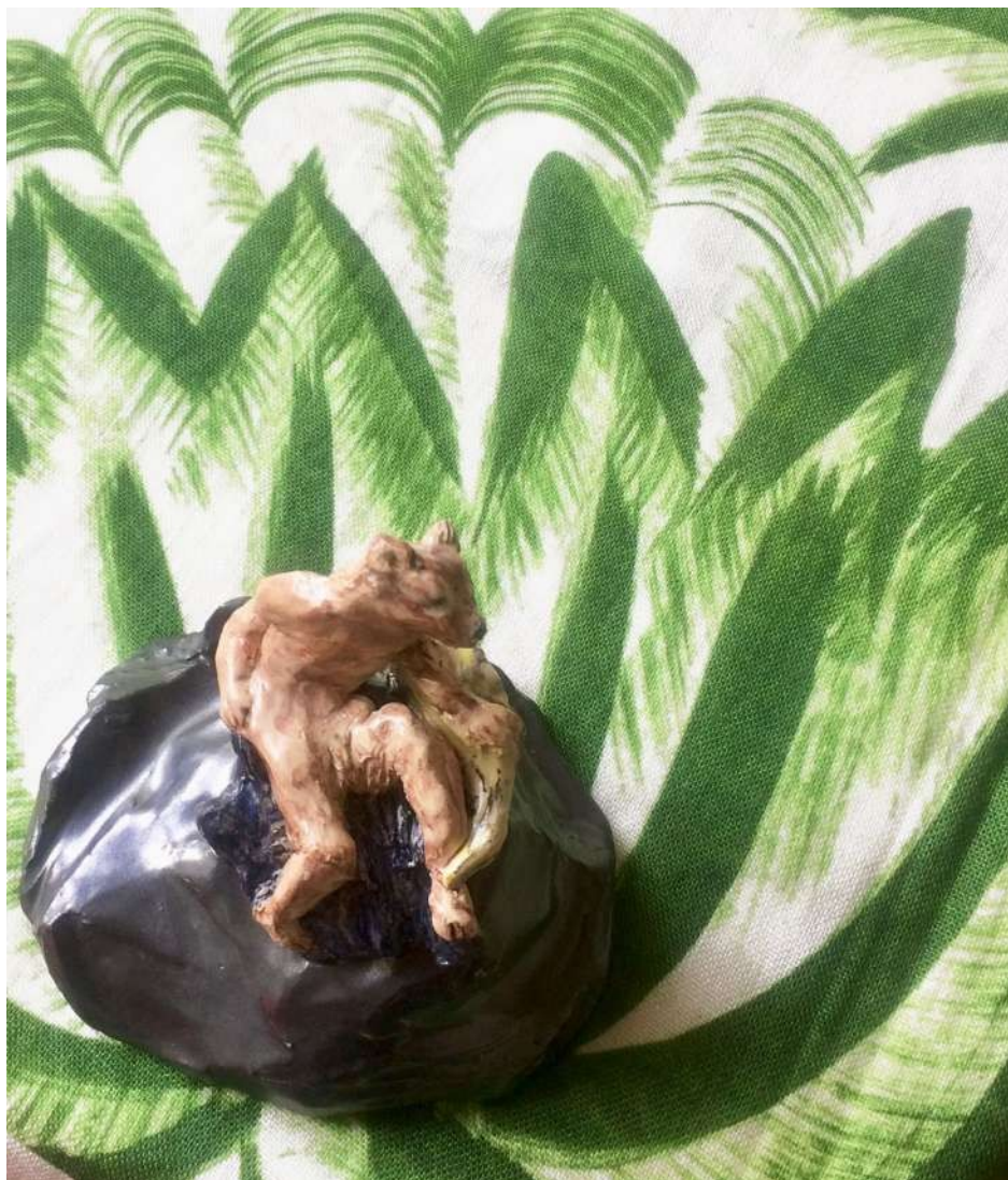
Installation Jardin indiscret. Petit loup, faïence émaillée, h.9,5 x 12 x 10 cm, avec tissu Barok en lin imprimé