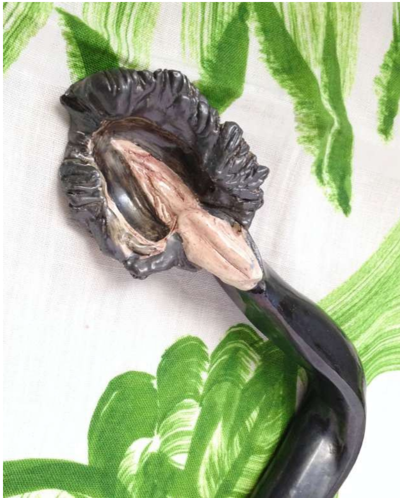
Installation Jardin indiscret. Tuyau-fleur, faïence émaillée, h.5,5 x 30 x 17 cm, avec tissu Barok en lin imprimé