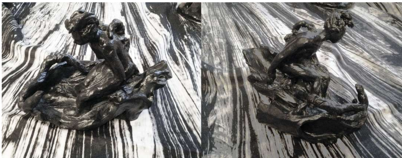
Installation Tempête. Lieu 2, faïence émaillée, h.22 x 31 x 18 cm, avec tissu Window wash en lin imprimé

Vernissage jeudi 23 janvier 2020 à partir de 18h30