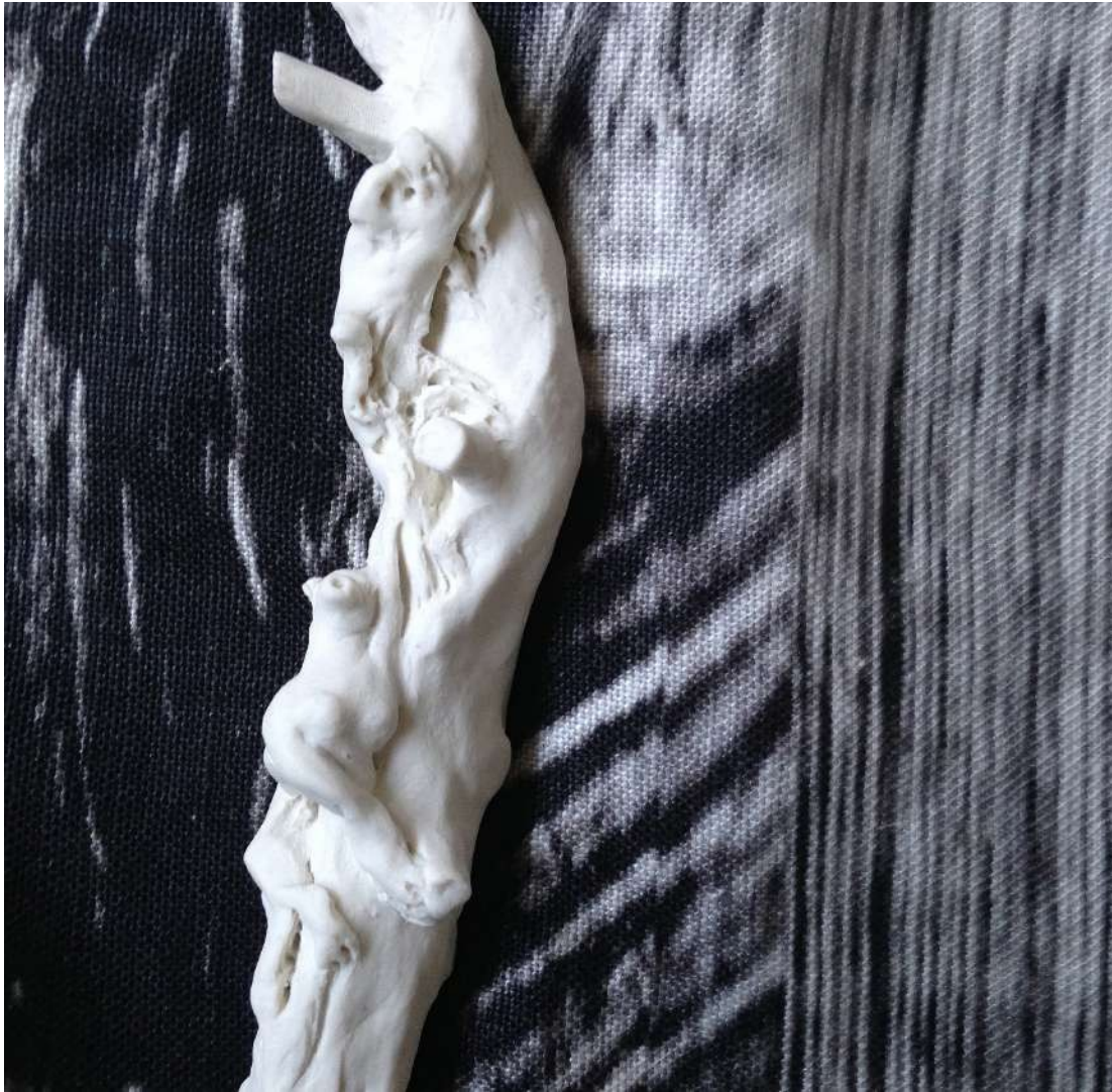
Installation Tempête. Grimpant, porcelaine biscuit, h.17,5 cm, avec tissu Window wash en lin imprimé