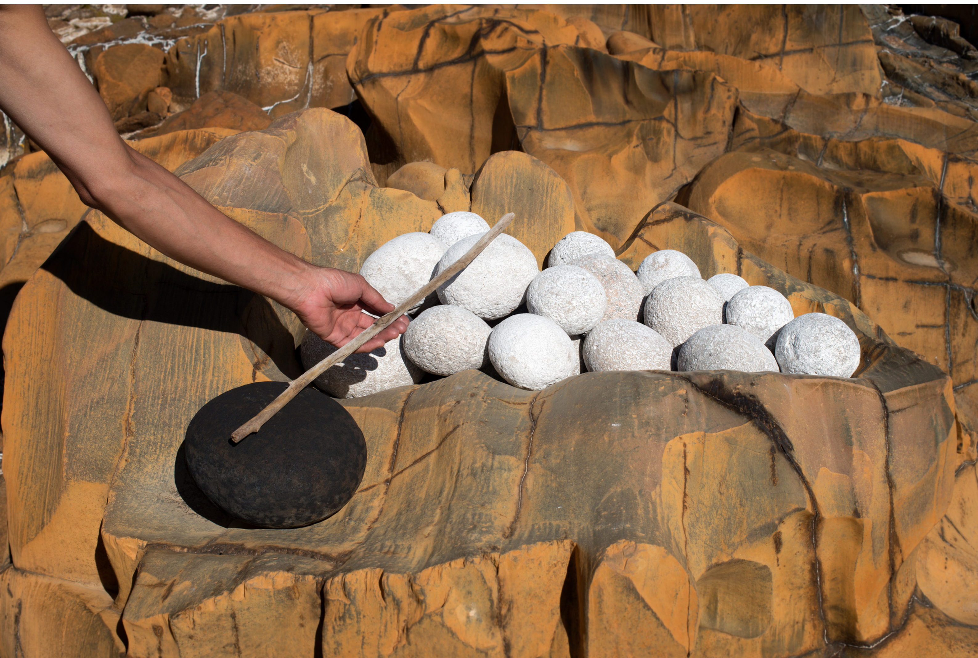
Point zéro #06, Rodrigo Braga, 2019