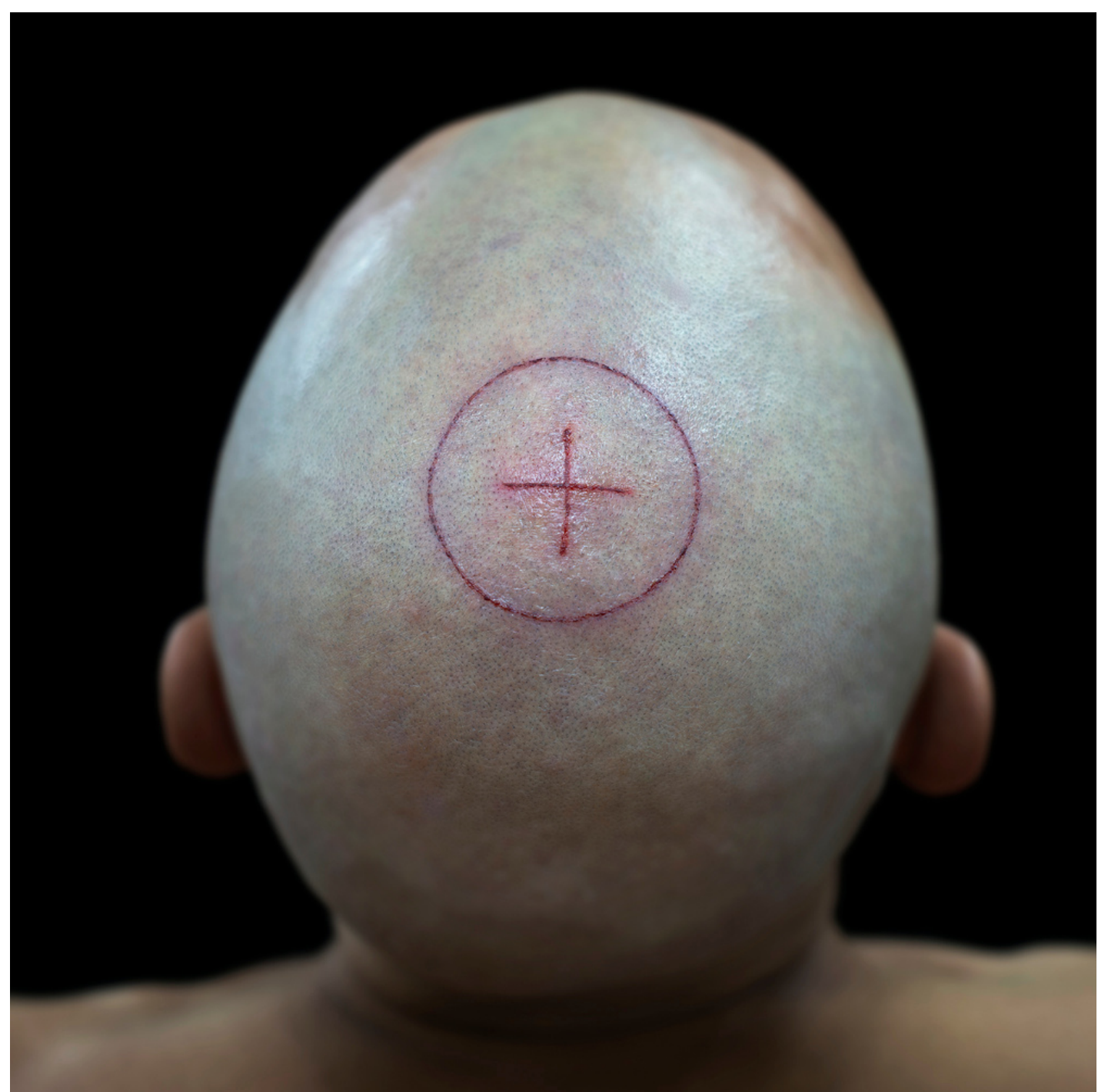
-/+, Rodrigo Braga, 2021