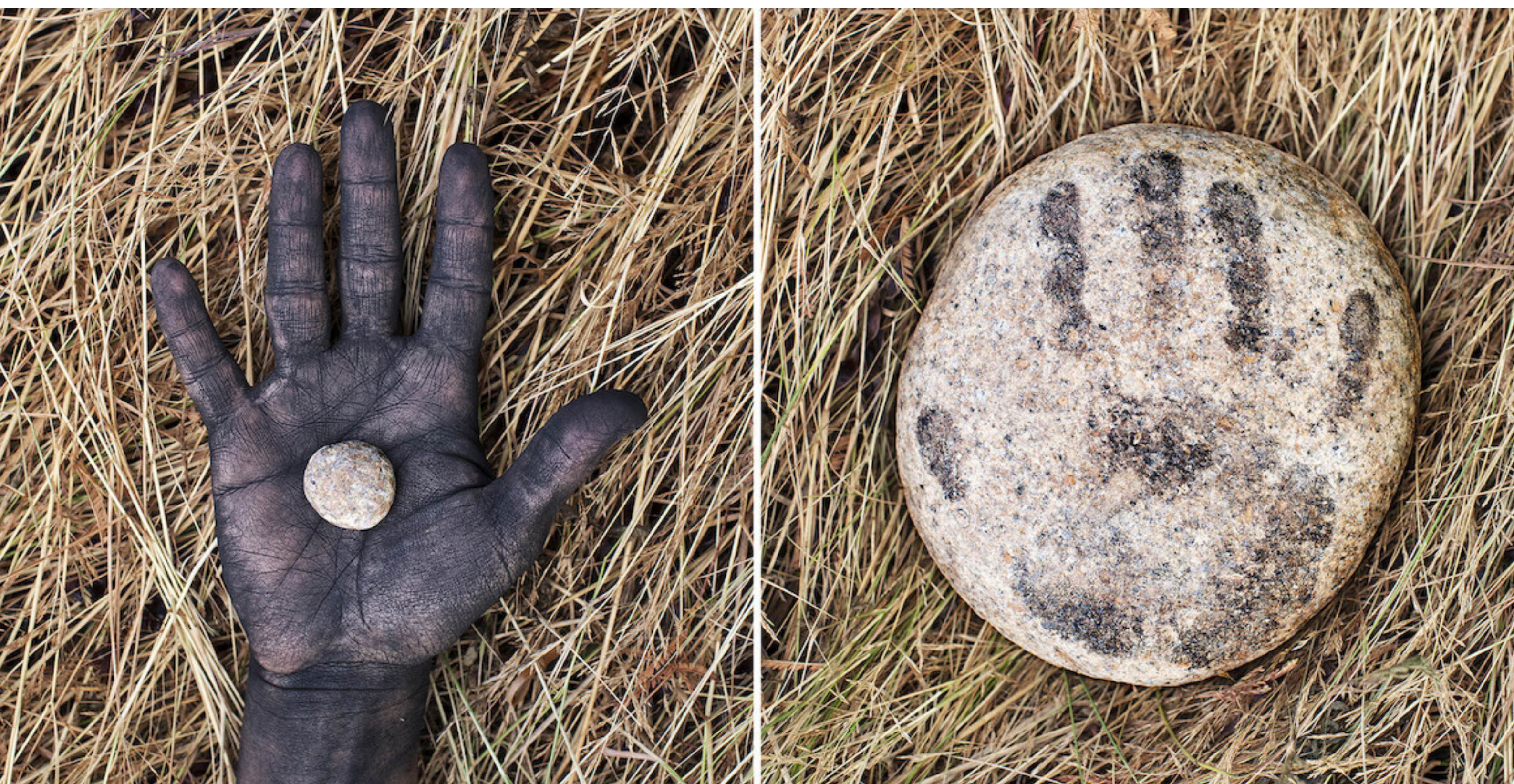
Point zéro #04, Rodrigo Braga, 2019

Ses œuvres sont présentes dans plusieurs collections publiques, en particulier le Musée d'art moderne de São Paulo et la Maison Européenne de la Photographie à Paris, et dans de grandes collections privées.