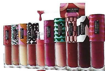
5 Mireille Assénat