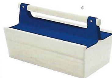
3 Danièle Gerkens