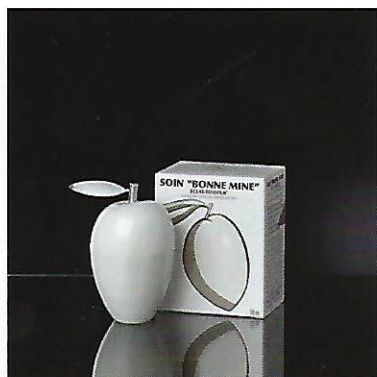
7 Élisabeth Martorell