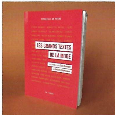
2 Nathalie Dolivo