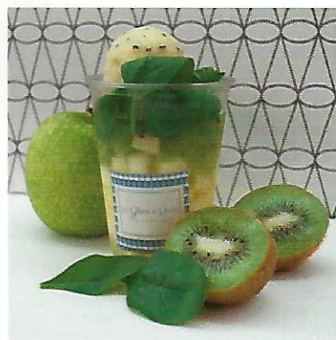
6 Caroline Ignazi